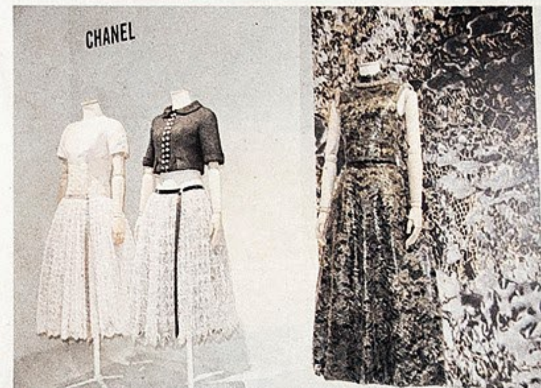
La maison Chanel ouvre l'exposition.